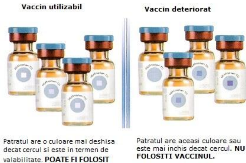
Fig.1 Stadiile VVM