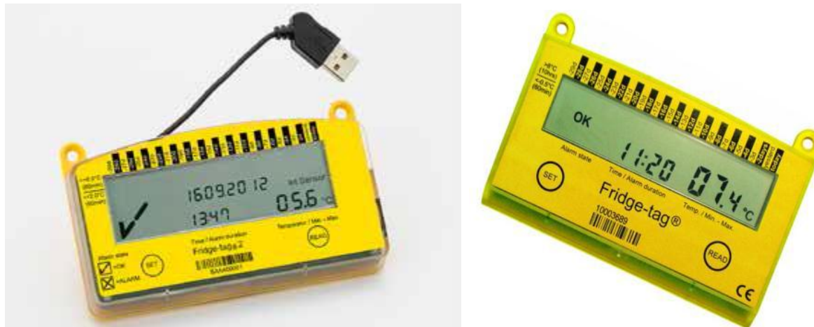
Fig. 4 Dispozitive de monitorizare continua a temperaturii(Fridge-tag) cu si fara USB

Toate temperaturile citite folosind termometrul gradat cu coloana de alcool sau logger-ul vor fi mentionate in graficul zilnic de monitorizare a temperaturii prezentat in "Procedura in caz de avarie a echipamentelor frigorifice utilizate pentru depozitarea vaccinurilor".