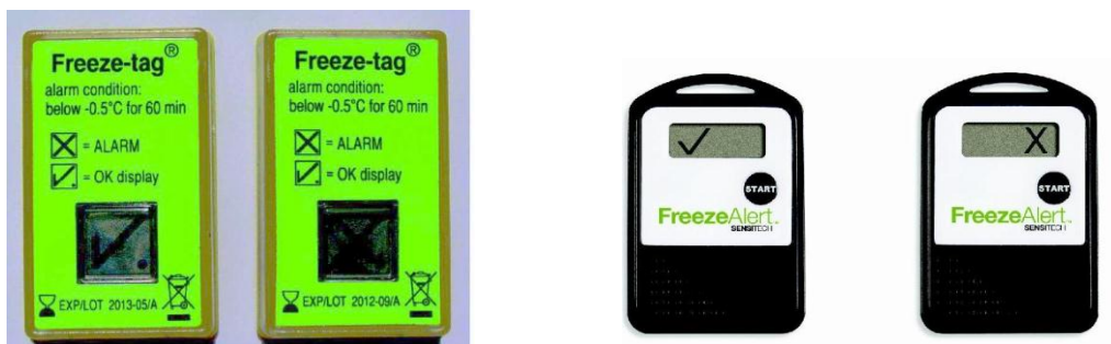
Fig.nr.3 Cele doua tipuri de indicatori de inghet certificate de OMS